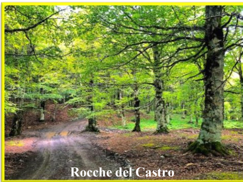
Rocche del Castro