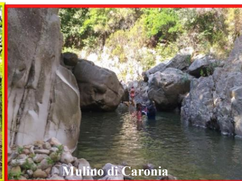
Mullino di Caronia