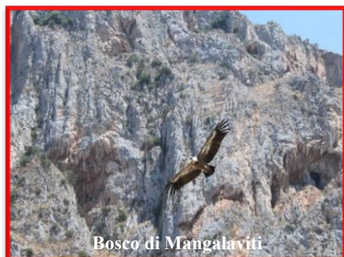
Bosco di Mangalaviti

Lunghezza: 12/16 km Durata: 4/6 h Difficoltà: media